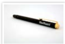
Stylus pero (součást balení)